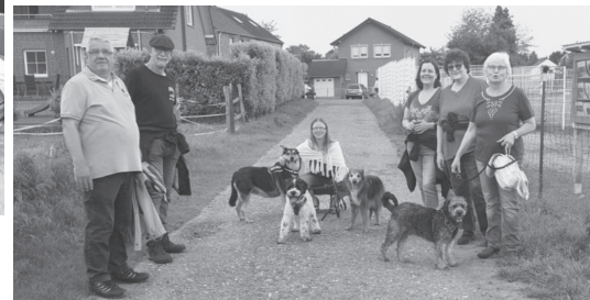
Foto oben: Treffpunkt Geilenkirchener Str. 397 Foto unten: ... von unterwegs

An jedem Donnerstag startet ab Martin-Luther-Kirche in Merkstein um 9:00 Uhr eine Gruppe Frauen und Männer in unterschiedlicher Zusammensetzung zu einem 60 bis 90 minütigen Spaziergang.